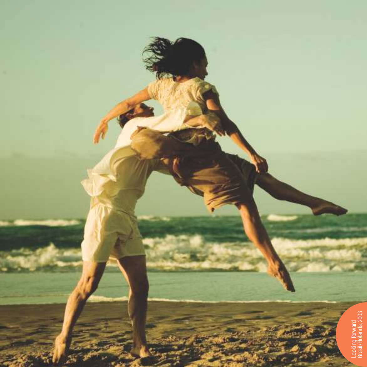
Looking forward Brasil/Holanda, 2003

O dança em foco define-se como um Festival Internacional de Vídeo & Dança. Os diversos modos em que dialogam vídeo e dança - ou, mais abrangentemente, imagem e corpo - são, portanto, o seu tema. Para além das fronteiras definidas, interessa ao projeto as proposições transmidiáticas, lugar de invenção, descoberta e experimentação da arte de hoje.