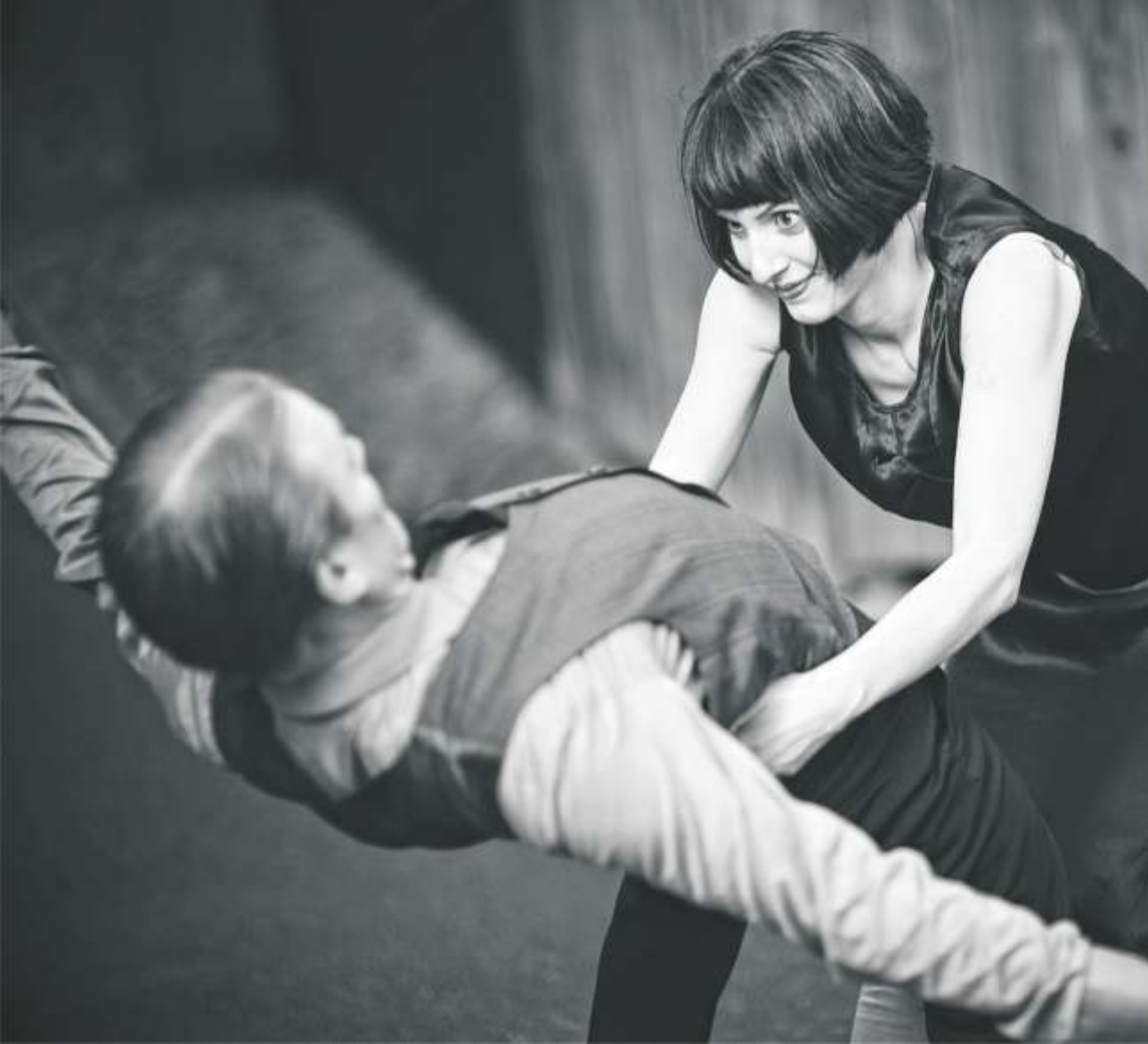
Tickle me to death (original title: Kild mig ihjel) Dinamarca, 2010